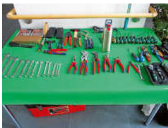
Bereit für die Reparaturhilfe...

Unser nächster Termin ist am 20. April 2024 im SONNENHOF in Waldenbuch, Vordere Seestraße 19.