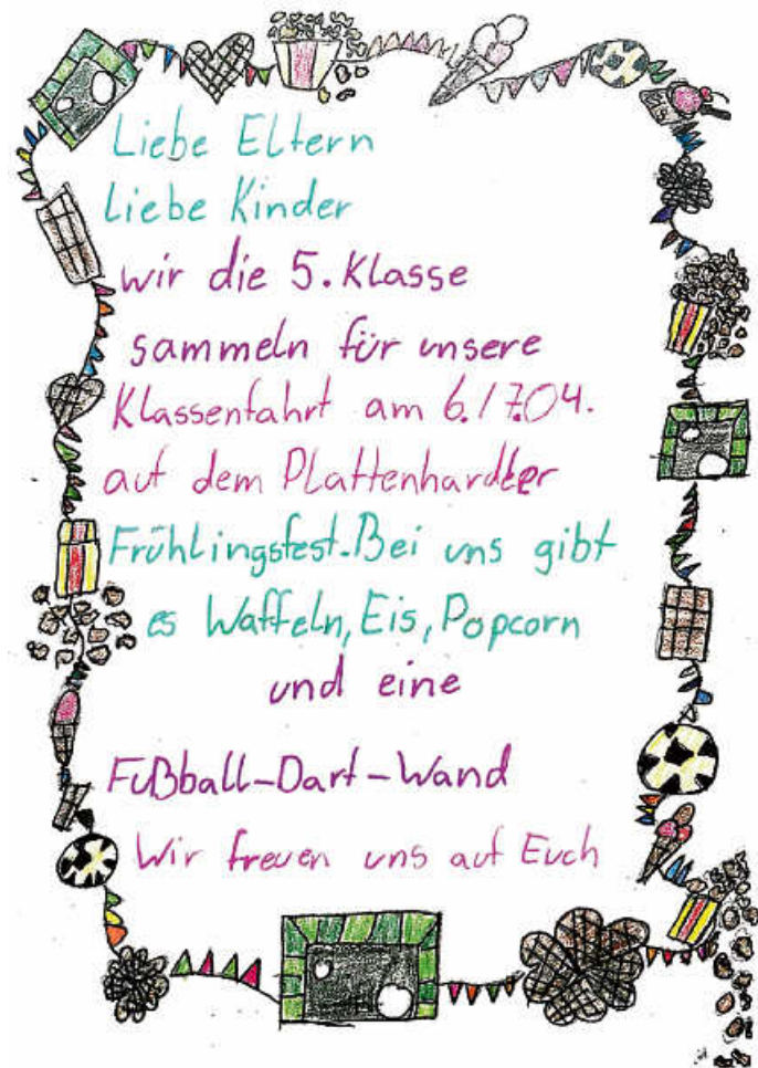
Plakat: Die 5. Klasse