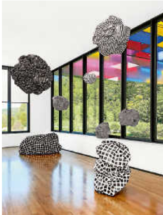
Rozbeh Asmani. All Our Colours & Made of Paper

Die aktuellen Ausstellungen sind noch bis 7. April 2024 zu sehen: