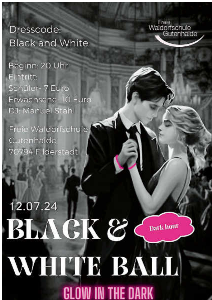
Plakat: 11. Klasse