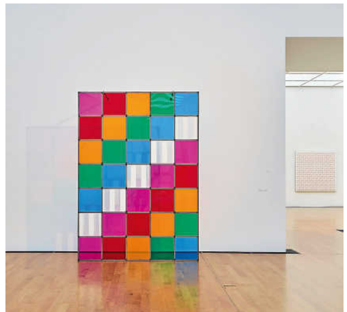
Foto: Daniel Buren, Cadre décadré 19 D3, 2006; Luis Tomasello, Atmosphère chromoplastique n° 846, 2006