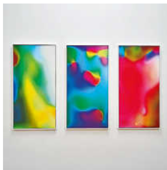
Foto: Larenz Theinert, Farbreste, 2016 © Künstler, Foto: Andreas Sporn