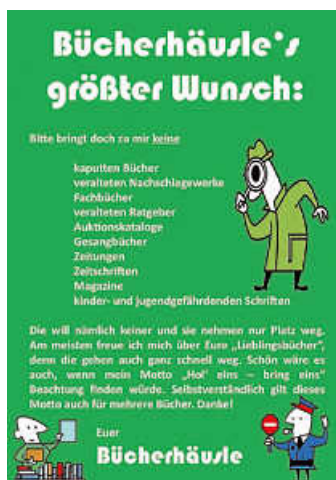
Plakat: Walter Krämer

Über die Dauer der POP-UP STRANDBAR (bis 31.8.2024) ist kein Schachspiel möglich.