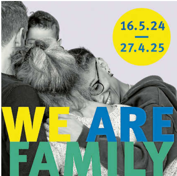
Key Visual

Jeden letzten Sonntag im Monat 11 Uhr: Familie ärgere dich nicht! Öffentliche Spielführung für Familien.