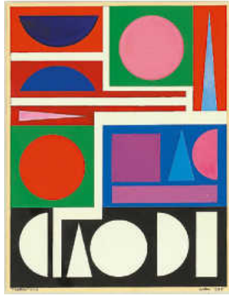
Foto: Auguste Herbin, nature n° 1, 1955 © VG Bild-Kunst, Bonn 2024

Auguste Herbin hat in seinen Bildern Botschaften versteckt. Mit der Künstlerin Annie Krüger entschlüsseln wir seine Werke und gestalten im Freien ein rätselhaftes Kunstobjekt aus Naturmaterialien. Bitte Brotzeit und wetterfeste Kleidung mitbringen! € 15, inkl. Material, für Kinder ab 7 Jahren, Anmeldung erforderlich unter Tel. 07157 53511-40 oder an der Museumskasse.