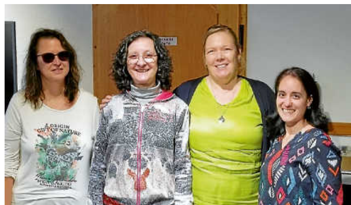
Das neue Vorstandsteam