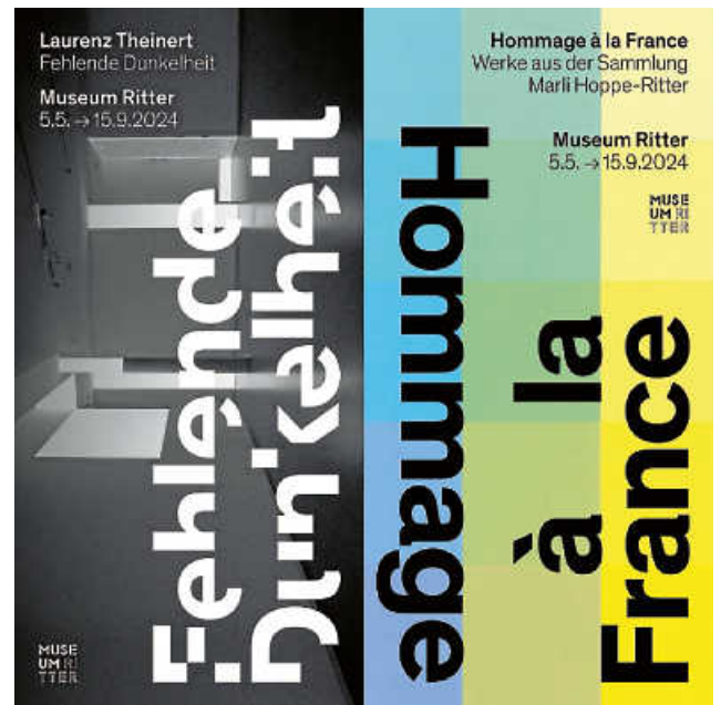
Foto: Laurenz Theinert, The Awakening , 2020 (Stuttgart, 2022, Detail) © Künstler, Foto: Laurenz Theinert / Hugo Demarco, Lumière , 1979 © Künstler, Foto: Gerhard Sauer

Der Stuttgarter Lichtkünstler Laurenz Theinert ist für Live-Performances bekannt, bei denen er über ein eigens erfundenes „Visual Piano“ im Zusammenspiel mit Musikern dynamische Lichtzeichnungen in den Raum projiziert. Dass Laurenz Theinert auch fotografisch arbeitet und Lichtinstallationen schafft, zeigt die neue Einzelausstellung im Museum Ritter. Parallel lässt eine Präsentation mit Arbeiten aus der Sammlung Marli Hoppe-Ritter die Geschichte der konkreten Kunst in Frankreich Revue passieren. Gemälde, Reliefs, Objekte sowie kinetische Werke von Künstlerinnen und Künstlern wie Victor Vasarely, Vera Molnar, François Morellet, Geneviève Claisse und Aurélie Nemours führen den regen Austausch innerhalb der französischen Kunstszene vor Augen.