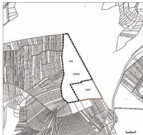
Lageplan 16.04.2024 Vorkaufsrechtssatzung, ohne Maßstab.

Die Satzung tritt am Tag ihrer öffentlichen Bekanntmachung in Kraft.