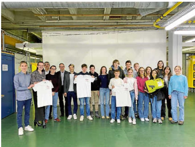
Unser Team des Schulsanitätsdienstes