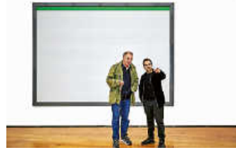
Foto: Andreas Bee und Rozbeh Asmani vor: Colourmarks Billboard, Schmack Biogas GmbH, 2023 © Künstler