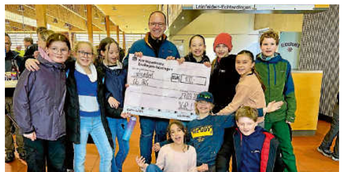
Unsere glücklichen Gewinner