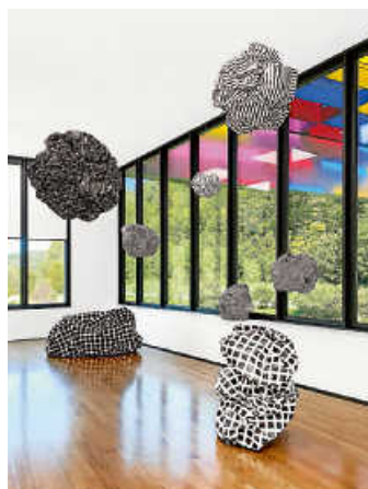
Foto: Esther Stocker, Paper Planets , 2023 © Künstlerin, Foto: Esther Stocker

Rozbeh Asmani. All Our Colours & Made of Paper In der Zeit vom 8. April bis zum 4. Mai bleibt das Museum Ritter wegen Ausstellungsumbaus geschlossen.