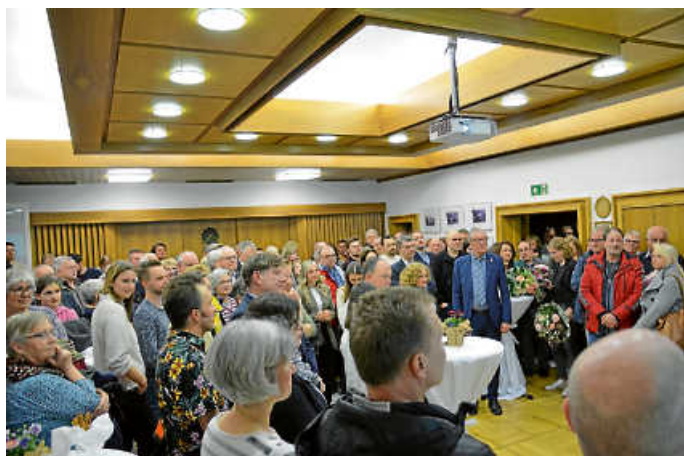
Zahlreiche Bürgerinnen und Bürger warteten im Großen Sitzungssaal gespannt auf die Bekanntgabe des Wahlergebnisses

In der Zeit von 08:00 bis 18:00 Uhr waren die Wahllokale geöffnet. In dieser Zeit suchten 2.761 Bürgerinnen und Bürger ihr Wahllokal auf. Weitere 910 Personen beteiligten sich durch Briefwahl, sodass insgesamt 3.671 Wähler ihre Stimme abgegeben haben. Dies entspricht einer Wahlbeteiligung von 54,43 %.