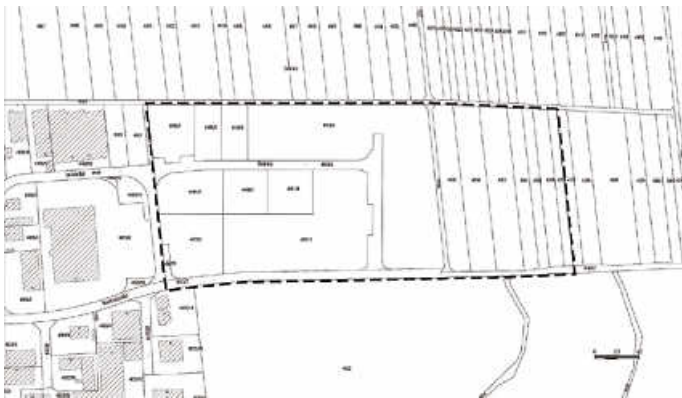
Abbildung 1: Geltungsbereich Bebauungsplan und örtliche Bauvorschriften „Bonholz III – 2. Änderung und Erweiterung“, ohne Maßstab

Der räumliche Geltungsbereich des Bebauungsplans und der örtlichen Bauvorschriften ergibt sich aus dem abgedruckten Kartenausschnitt, der im Folgenden dargestellt ist. Maßgebend ist der Lageplan des Bebauungsplans in der Fassung vom 19.03.2024.