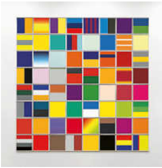
Foto: Rozbeh Asmani, Colourmarks , 2013–17 © Künstler, Foto: Andreas Sporn, Sammlung FEBEMA