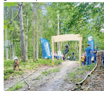
Los geht's durch das Portal direkt mit den ersten Sprüngen.

Unter der Verantwortung des Mountainbikes Stuttgart e. V. Ortsgruppe Siebenmühlental sowie den ca. 20 Jugendlichen aus