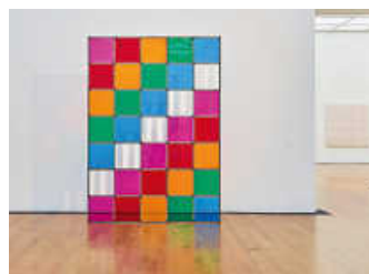
Foto: Daniel Buren, Cadre décadaire 19 D3, 2006 ; Luis Tomasello, Atmosphère chromoplastique n° 846, 2006