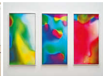
Foto: Laurenz Theinert, Farbreiste, 2016 © Künstler, Foto: Andreas Sporn.