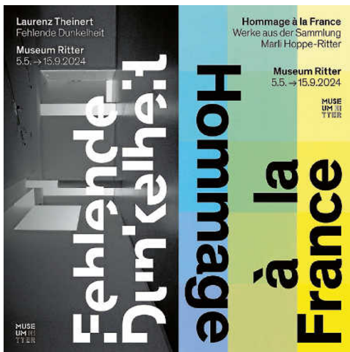
Foto: Laurenz Theinert, The Awakening, 2020 (Stuttgart, 2022, Detail) © Künstler, Foto: Laurenz Theinert / Hugo Demarco, Lumière, 1979 (Detail) © Künstler, Foto: Gerhard Sauer

Laurenz Theinert. Fehlende Dunkelheit // Hommage à la France. Werke aus der Sammlung Marli Hoppe-Ritter bis 15. September 2024