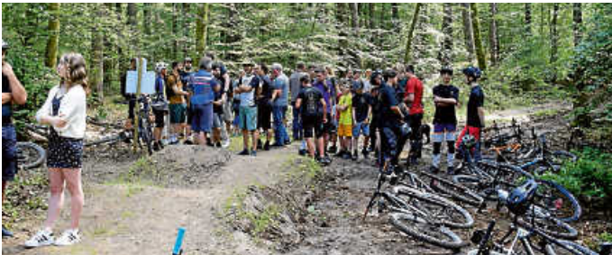
Viele Mountainbiker sind zur Eröffnung gekommen, um den Brezeltrail als einer der Ersten herunterzufahren.