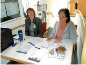
Unsere Spezialistinnen bei der Anmeldung

Sie möchten auch Ihr Hobby mit anderen teilen? Wir helfen Ihnen gerne bei der Suche nach Gleichgesinnten. Geben Sie uns einfach Ihre Wünsche bekannt. Nehmen Sie bei Interesse bitte mit uns Kontakt auf, wir vermitteln dann weiter. Die Kontaktmöglichkeiten zu uns sind am Ende unseres Beitrages aufgeführt.