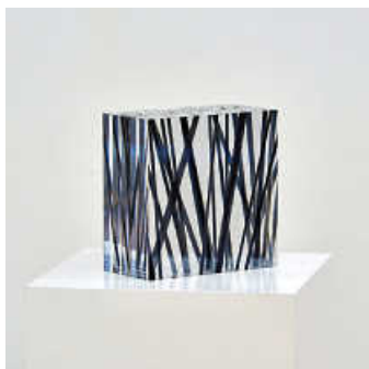
Foto: Laurenz Theinert, Raumverdichtung 7, 2006 © Künstler, Foto: Andreas Sporn