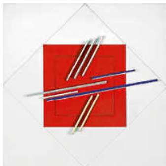
Foto: Jean Gorin, Composition s patio-temporelle multivisuelle n° 63, 1971 © Künstler, Foto: Gerhard Sauer.