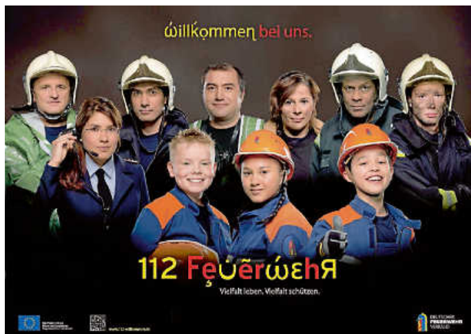
Plakat: Dt. Feuerwehrverband