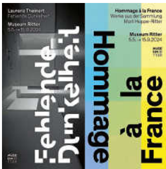
Plakat: Laurenz Theinert, The Awakening , 2020 (Stuttgart, 2022, Detail) © Künstler, Foto: Laurenz Theinert / Hugo Demarco, Lumière , 1979 © Künstler, Foto: Gerhard Sauer.