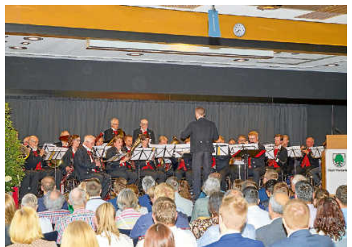
Musikalische Darbietung des Musikverein Stadtkapelle Waldenbuch

Musikalisch begleitet wurde der offizielle Teil durch die Stadtkapelle Waldenbuch, welche mit ihrer abwechslungsreichen Liedauswahl für gute Stimmung und viel Beifall sorgten. Von klassischen Stücken wie dem Florentiner Marsch über den Choral „Wie lieblich ist der Maien“ bis hin zu einem Medley der deutschen Pop-Band PUR oder „An Tagen wie diesen“ von den Toten Hosen war alles dabei.