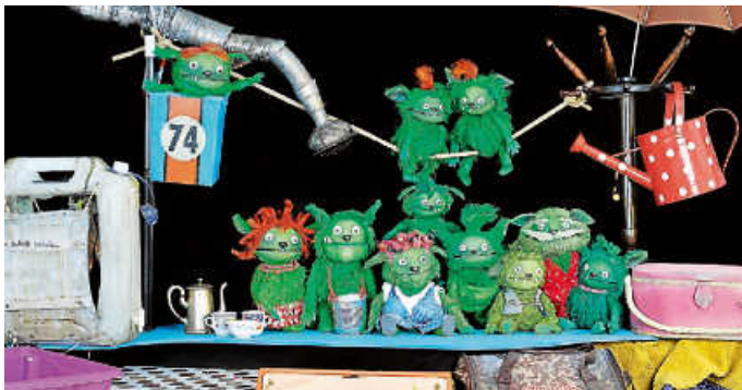
Figurentheater „Die Krumpflinge“ - Egon zieht ein,, eine Koproduktion "Figurentheater Martinshof 11,, und "Figurentheater Berta & Co"

Eintritt in die Ausstellungen ist kostenfrei!