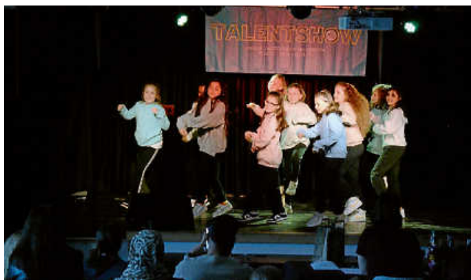
Die Dancing Kids auf der Bühne.

Den Abend eröffnete ein Tanz-Duo aus Calw, welche die letzte Calwer Talentshow des dortigen Jugendhauses gewonnen hatte. Nach dem gelungenen Einstieg hatte jedes der 8 Talente (wobei manche auch als Duo oder als Gruppe auftraten) die Möglichkeit, bei zwei Auftritten die 4-köpfige Jury und das Publikum von sich zu überzeugen. Viele starke Stimmen boten tolle Gesangsnummern dar. Es wurde musikalisch beim Klavierspielen, improvisierte Comedy gezeigt und natürlich auch mit viel Rhythmus und Taktgefühl getanzt.