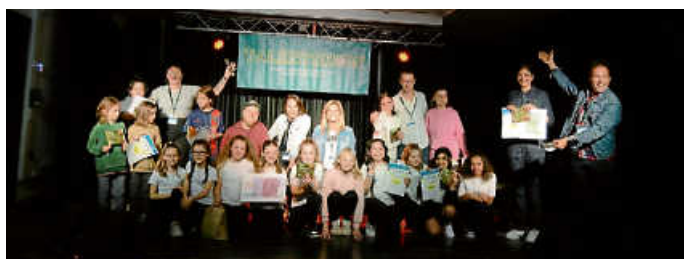
Alle Talente auf der Bühne.

Zu guter Letzt musste die Jury zu einer Entscheidung kommen - worum sie bei so vielen guten und tollen Auftritten wahrlich nicht zu beneiden war. Vor der Bekanntgabe der drei Sieger des Abends wurde von der Jury nochmals deutlich hervorgehoben, dass es an diesem Abend für die Jury und das Publikum nur Gewinner gab. Alle Talente hatten eine tolle Performance abgeliefert und gezeigt, mit wie viel Spaß und Freude sie dabei waren. Folgende Talente konnten mit ihren Darbietungen vor vollem Haus die Erstplatzierungen des Wettbewerbs gewinnen: Platz 3 belegte eine 15-Jährige Sängerin aus Holzgerlingen Platz 2 ging an eine 13-Jährige Sängerin aus Waldenbuch Platz 1 und somit das Preisgeld von 80.- Euro ging an die Tanzgruppe „Dancing Kids“ aus Waldenbuch, welche mit zwei großartigen Darbietungen alle Zuschauenden im W3 begeistert hatten.